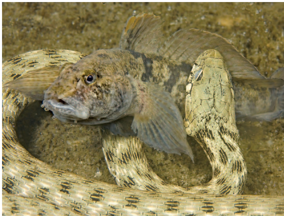
Viktor Vrbovský, Opava – Dramata pod hladinou I. (Užovka podplamatá, Hlavačka mramorovaná).