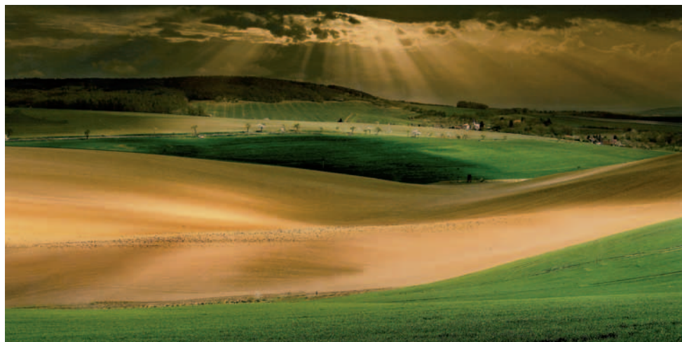
Ján Záhornacký, Kroměříž – Ohrozená krajina

VELAN LIBOR , Bystřice pod Lopeníkem Skutečný příběh žitkovských bohů I-II